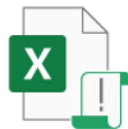
2021秋季記録会(一般用).xlsm