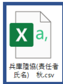
兵庫陸協(責任者氏名) 秋.csv